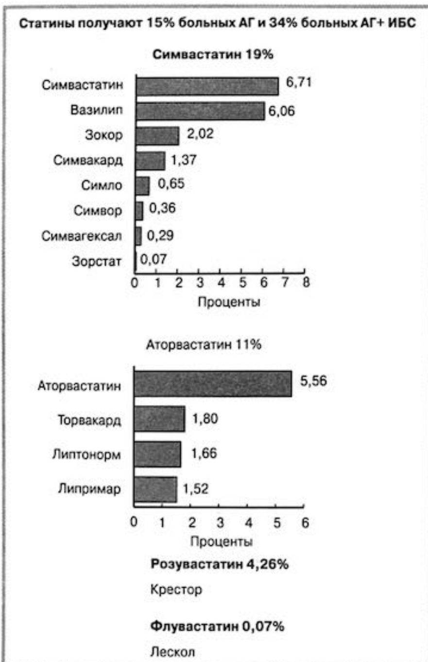
Рис. 6. Частота приема больными АГ/ИБС статинов.

рецепторов АП получают 4,95% больных АГ и 8,15% больных АГ с ИБС (различия существенны, p < 0,05 ). Самый часто назначаемый антагонист рецепторов АП — лозартан.