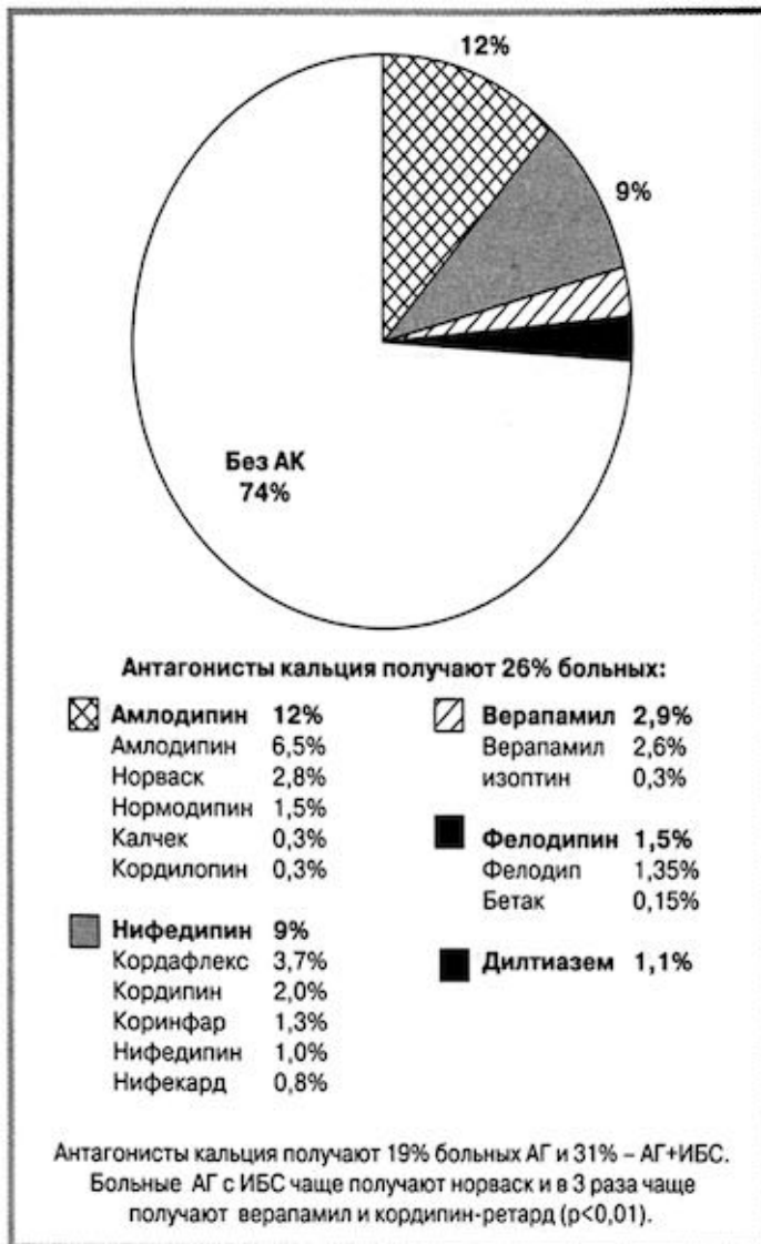
Рис. 3. Частота приема больными АГ/ИБС антагонистов кальция. АК — антагонисты кальция.

Второй по частоте использования класс антигипертензивных препаратов — это диуретики (рис. 2). Их получают 40% больных изолированной АГ и каждый третий (31%) больной с сочетанием АГ и ИБС. Индапамид назначается существенно чаще, чем гипотиазид: в 4 раза чаще при АГ и в 2 раза чаще у больных с сочетанием АГ и ИБС. При сравнении с ранее проведенными исследованиями становится очевидным, что сегодня при лечении АГ диуретики стали использоваться чаще, кроме того, врачи отдают предпочтение индапамиду (в исследовании ПИФАГОР-2 врачи декларировали назначение индапамида и гипотиазида примерно в равных долях, а в исследовании АРГУС-1 больные получали гипотиазид в 1,5 раза чаще). Различий по приему диуретиков в зависимости от регулярности/нерегулярности антигипертензивного лечения не обнаружено.