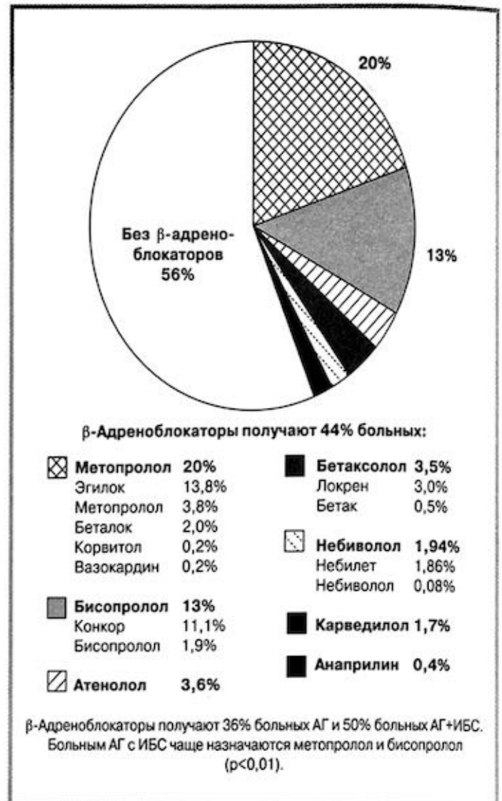
Рис. 4. Частота приема больными АГ/ИБС \beta -адреноблокаторов.

По сравнению с исследованиями, выполненными в прошлые годы, возросла частота назначения больным АГ \beta -адреноблокаторов (АРГУС-1 — 18%, ПИФАГОР-2 — 27%). В настоящее время \beta -адреноблокаторы получают 36% больных АГ и 50% больных с сочетанием АГ и ИБС; последние достоверно чаще получают метопролол ( p < 0,05 ), бисопролол ( p < 0,01 ) и бетаксоллол ( p < 0,05 ). Лидирующую позицию среди наиболее используемых \beta -адреноблокаторов занимает метопролол, и это большой шаг вперед по сравнению с недавним прошлым, когда наиболее часто у нас назначались атенолол и пропранолол. Из метопрололов с большим