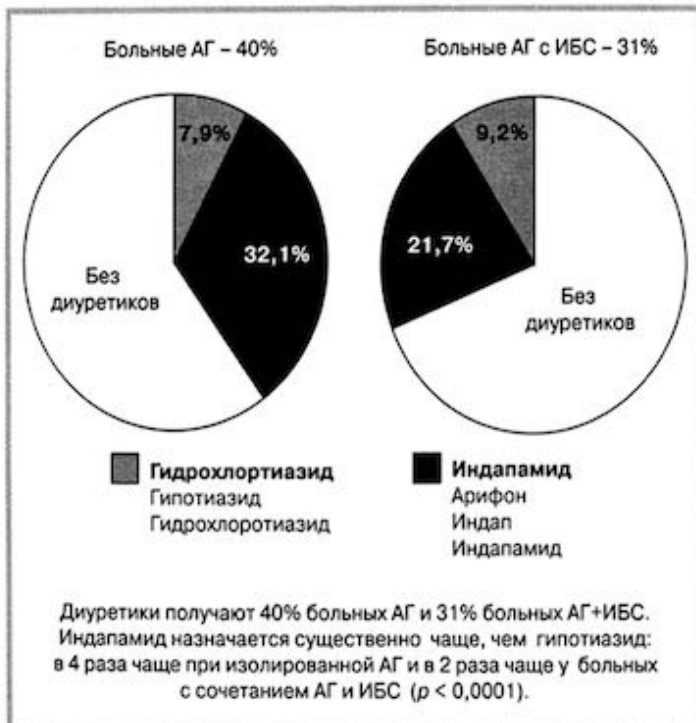
Рис. 2. Частота приема больными АГ/ИБС диуретиков.

ния; источниках медицинской информированности пациентов; мотивации больных к изменению образа жизни в желательном направлении и потребностях в профилактической помощи; приверженности больных к антигипертензивному лечению и факторах, влияющих на нее. Установлено, что нерегулярно при-