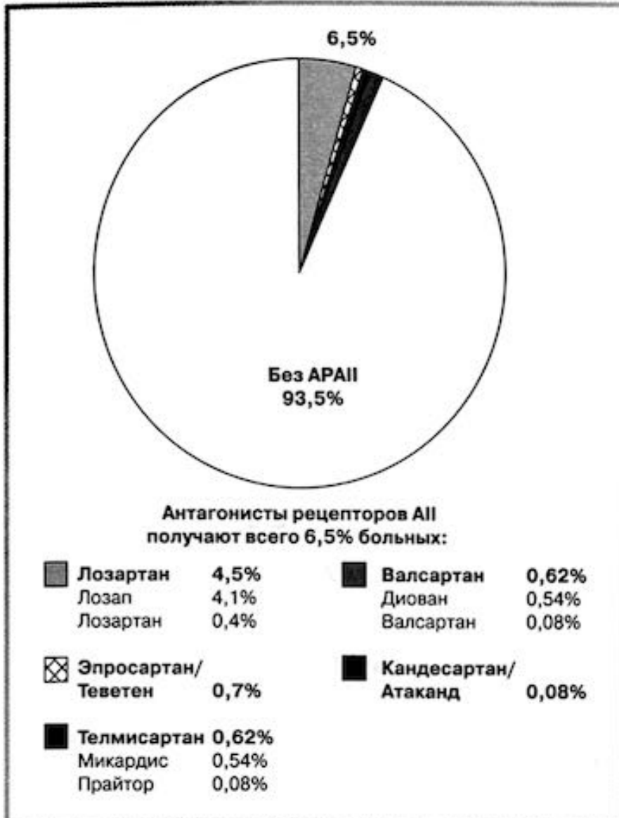
Рис. 5. Частота приема больными АГ/ИБС антагонистов рецепторов АП. АРА II — антагонисты рецепторов АП.