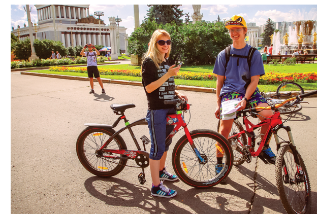
Велоквест «Я люблю тебя, Россия»

На Выставке будут оказывать консультативную помощь специалисты ФГБУ ГНИЦ профилактической медицины Минздрава России, ФГБУ НИИ питания РАН, Московского научно-практического центра наркологии Департамента здравоохранения города Москвы, Московского научно-практического центра медицинской реабилитации, восстановительной и спортивной медицины Департамента здравоохранения города Москвы и другие.