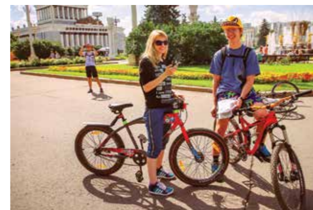
Велоквест «Я люблю тебя, Россия»

На Выставке будут оказывать консультативную помощь специалисты ФГБУ ГНИЦ профилактической медицины Минздрава России, ФГБУ НИИ питания РАН, Московского научно-практического центра наркологии Департамента здравоохранения города Москвы, Московского научно-практического центра медицинской реабилитации, восстановительной и спортивной медицины Департамента здравоохранения города Москвы и другие.